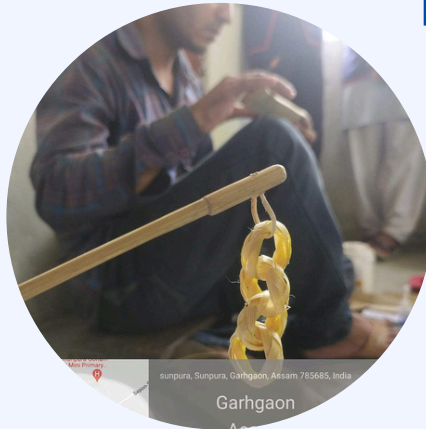
sunpura, Sunpura, Garhgaon, Assam 785685, India Garhgaon