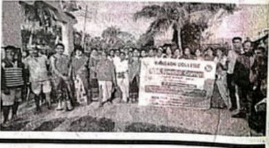
গড়গাঁও কলেজত বৈজ্ঞানিক কৃষি পদ্ধতিৰে কাঠফুলাৰ খেতি প্ৰশিক্ষণ কৰা হৈছে।