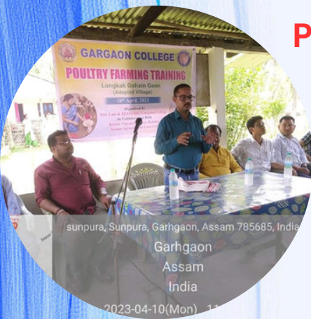
sunpura, Sunpura, Garhgaon, Assam 785685, India Garhgaon Assam India 2023-04-10(Mon) 11